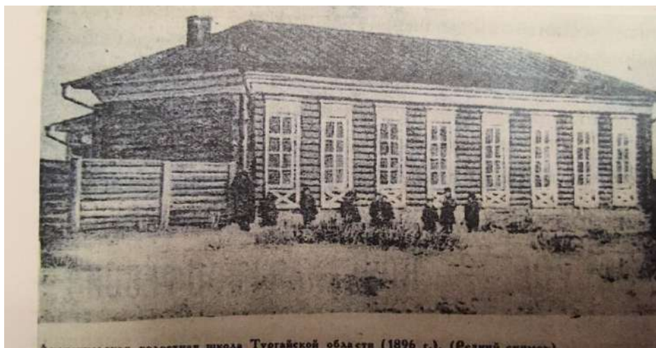
Торғай облысындағы Әуликөл болыстық мектебі (1896 жыл).