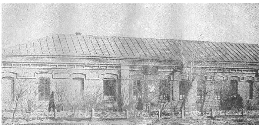
Қостанайдағы орыс- қазақ мектебінің жөнделгеннен кейінгі көрінісі

Мектепте 35 қазақ баласы тартылып, олардың саны жыл сайын өсе түсті.