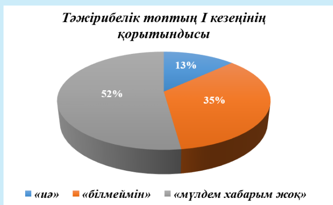
3-сурет – I кезең қорытындысы

Тәжірибенің I кезеңінің қорытындысынан соң бақылаушы және тәжірибелік топ мүшелеріне интервью әдісі негізінде сұхбаттар жүргізу тапсырылды. Барлық топ мүшелері осы кезеңде өздерінен қойылған сауалдарды еш өзгертусіз өздері арала-