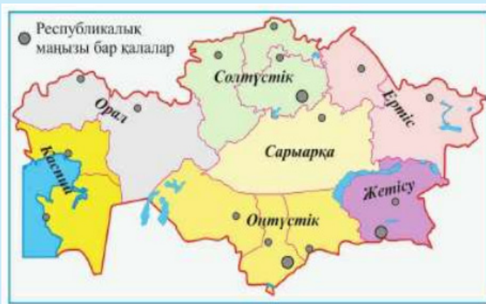
2-сурет. Қазақстан экономикалық аудандары (2006)

Отандық экономистер 2006 жылдары Қазақстанды 7 экономикалық ауданға бөліп қарастырған (2-сурет).