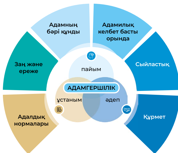
1 – сурет – Адамгершілікті қалыптастырудың моделі (Бұл моделді авторлар құрастырған)

Бұл модель белгілі бір ортада өзге адамға, өзіне қатысты шешімдерді қабылдауда адамгершілік пайымдарына жүгінеді, ұстанымдарын (приптеріне) сәйкес шешімдер қабылдайды, әдеп нормаларына сәйкес әрекет етеді. Ғылыми зерттеулерге талдау жасау негізінде білім беру ұйымдарында адамгершілік тәрбиесінің моделі әзірленді. Модель бала бойындағы адамгершілік қасиеттерді қалыптастыруға ықпал ететін басты адамгершілік пайым, әдеп, ұстаныммен байланысты түзіледі.