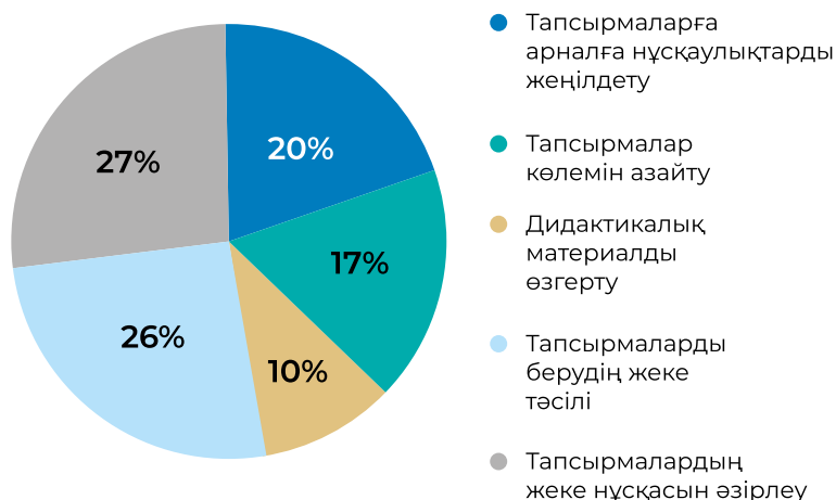
2-сурет. Оқу материалын бейімдеу әдістері, %

«Оқу материалын бейімдеудің қандай әдістерін қолдануға болады деп ойлайсыз?» сұрағына педагогтер көбінесе тапсырмалардың жеке нұсқаларын әзірлейтінін және тапсырмаларды беруде жеке әдістерді қолданатындығын көрсетті (тиісінше 27% және 26%). Респонденттердің көбі тапсырмаға берілген нұсқаулықтарды жеңілдетуге және тапсырмалар көлемін азайтуға аз жүгінеді (2-сурет).